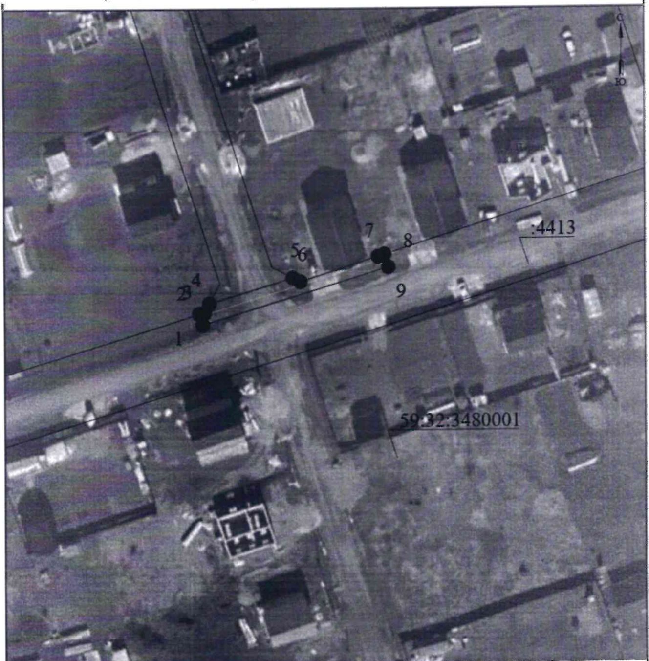
СХЕМА РАСПОЛОЖЕНИЯ ГРАНИЦ ПУБЛИЧНОГО СЕРВИТУТА Эксплуатация объекта электросетевого хозяйства «ВЛ-0,4 кВ КТП-6913 №3»

Приложение № 1 к распоряжению комитета имущественных отношений администрации Пермского муниципального округа от 24.03.2025 № 913